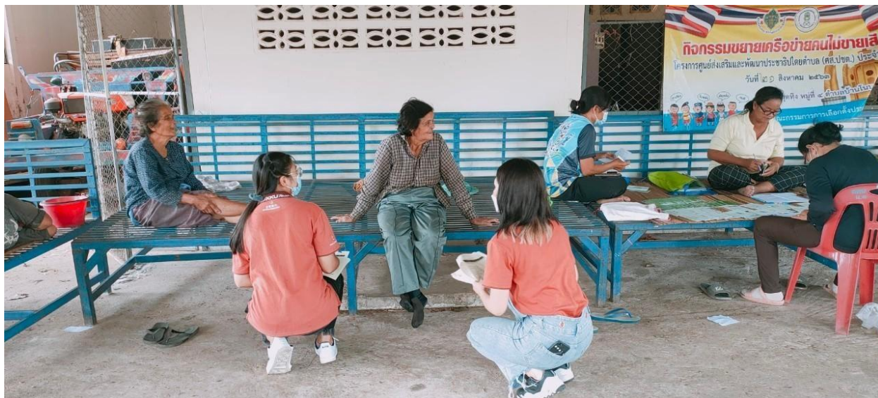
ภาพที่ 5.2 ทีมงานนักวิจัยลงพื้นที่แจกแบบสอบถามในเขตอบต.บ้านโนน อำเภอชำสูง (2)